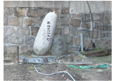
【玉造黒門瓜発祥の地】