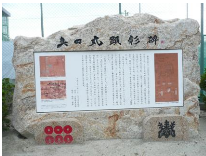
【「真田丸顕彰碑」推定地】