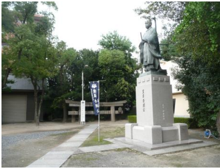
【玉造稻荷神社 豊臣秀頼像】