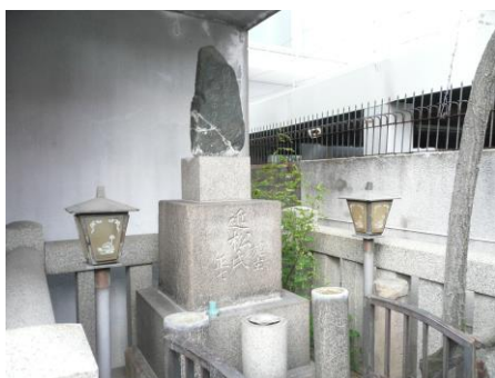
【「近松門左衛門」墓地】

国学の祖「契沖」が51歳から62歳まで住み『万葉代匠記』を記した。境内に「契沖」の墓がある。