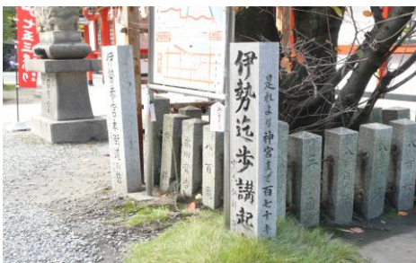
【伊勢迄歩講】の起点