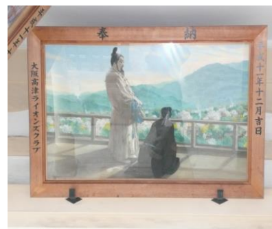
【仁徳天皇の逸話を伝える】

仁徳天皇は、この地から庶民の暮らしを眺めたとき、炊事の煙が全く上がっていないことから、民の暮らしは貧しいに違いないと考え、三年間の免税を行い、民の暮らしは豊かになったと伝わっている。